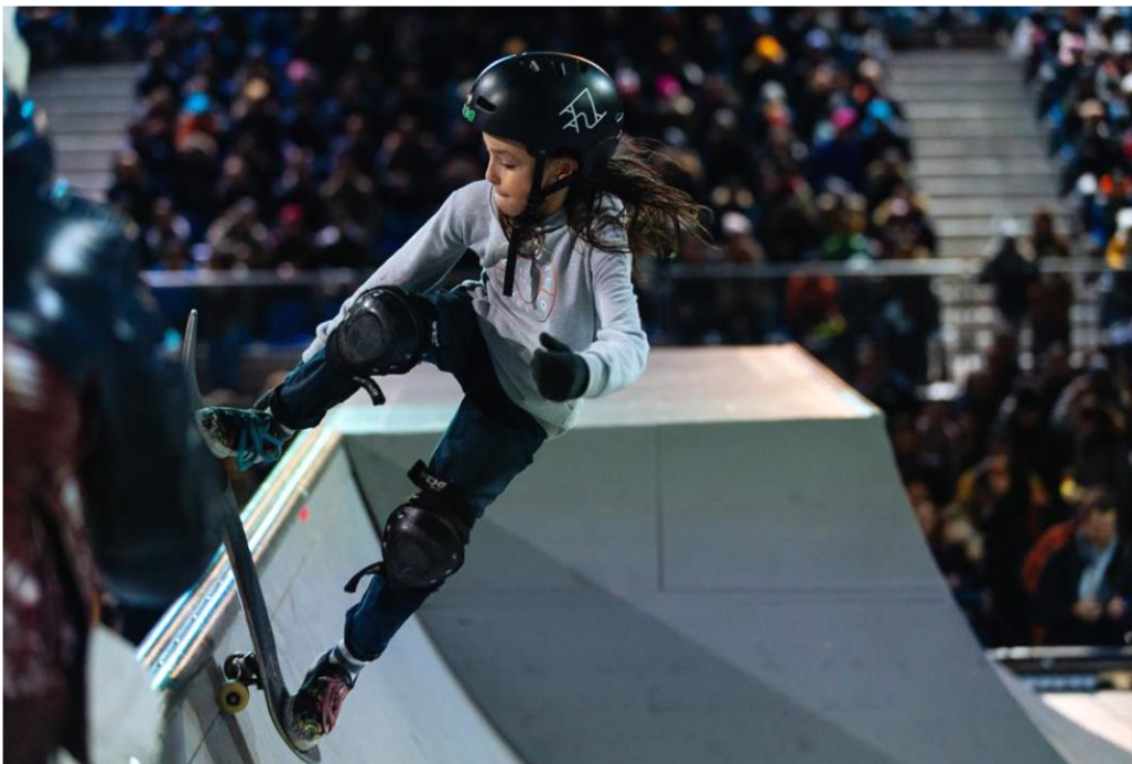
Body city, la glisse en ville de Lausanne, Jeux Olympique de la Jeunesse