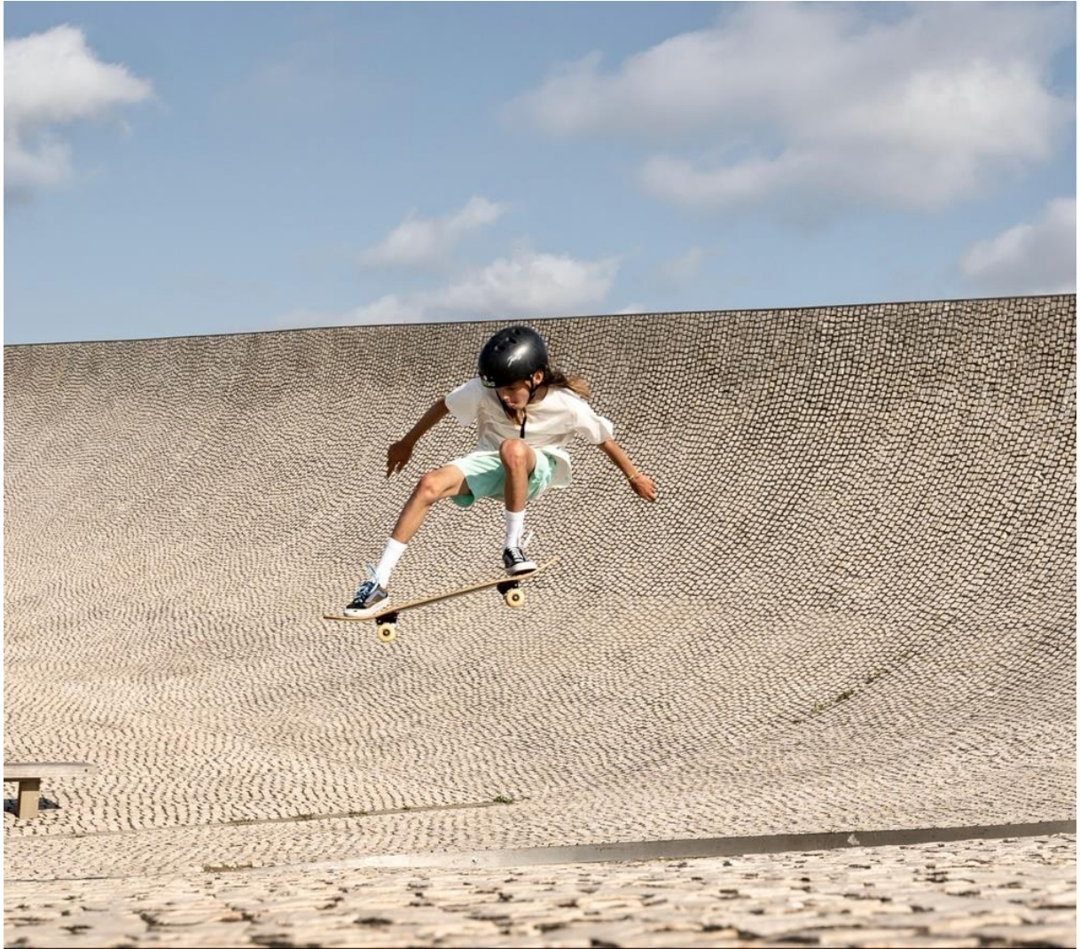
Cité de l'Océan, Biarritz, France