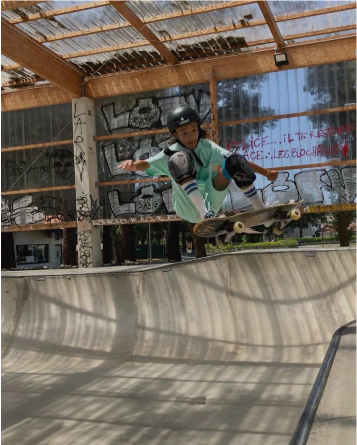
Landes, Capbreton, France