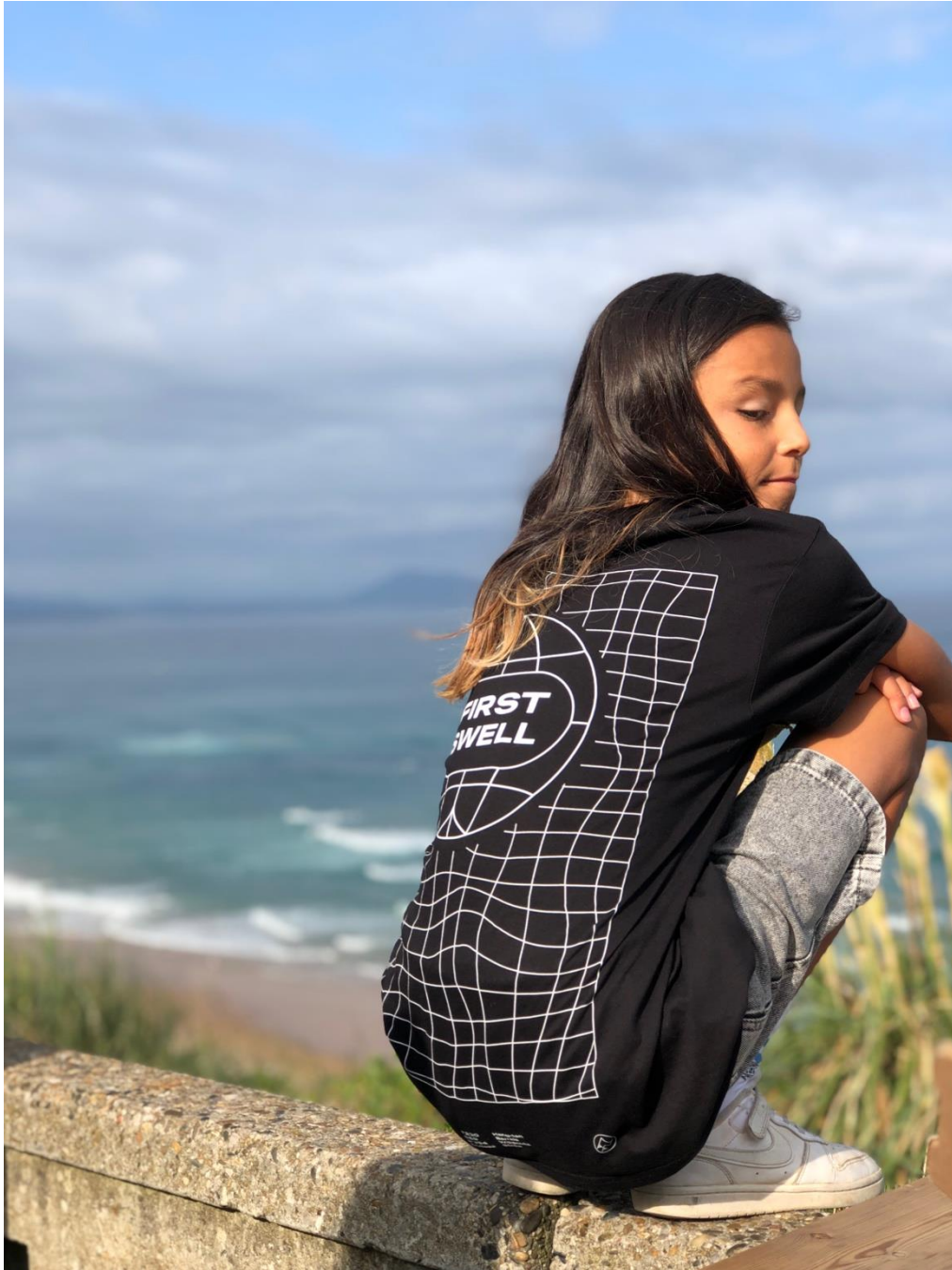
Pays-Basques, Biarritz, France